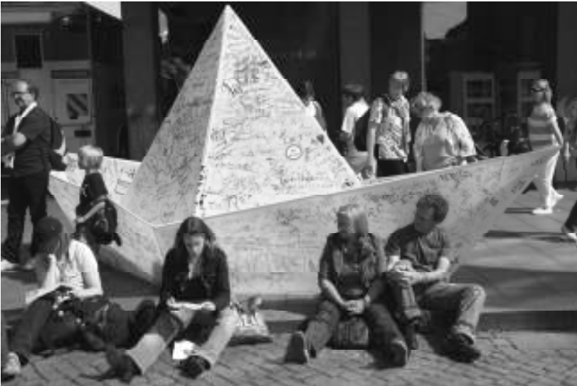
„Ein Schiff, das sich Gemeinde nennt“ – Kirchentag in Bremen