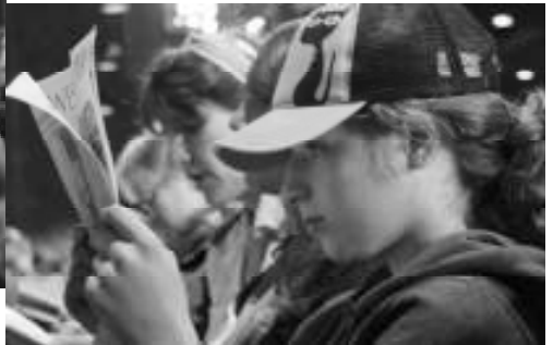
in der Kirchentagszeitung lesen -----

aus dem ----- Vaterunser in Gebärden- sprache