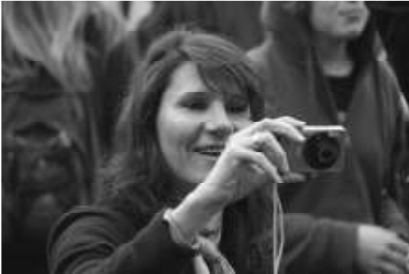
ein Photo muss doch sein!

Unvergesslich für uns wahrscheinlich, wie ein heftiger Gewittersturm über unser Zelt hinwegfegte, wie der Sturm den Regen durch die Zeltritzen drückte, heftig an den Planen zerrte und 2000 Menschen in Panik zu den Ausgängen drängten. Wir aber ließen keine Unruhe aufkommen und blieben ruhig und