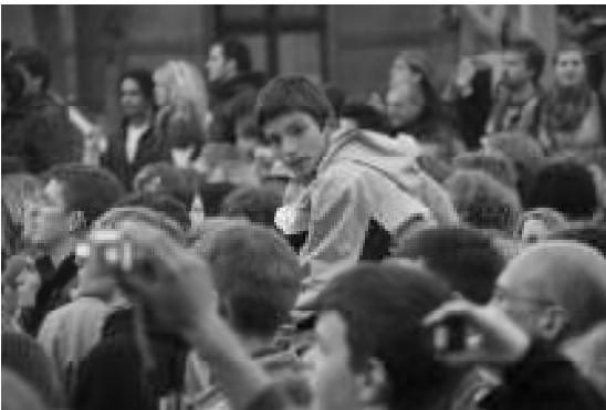
<---- Open Air Konzert in Bremen

gefasst am Platz sitzen. Hinaus in die Menschenmasse und in Regen und Wind hätte nur Gefahr gebracht. Einige wenige Verhaltensregeln tauschten wir aus und bald war der Spuk vorüber – fast so, wie im Boot der Jünger Jesu.